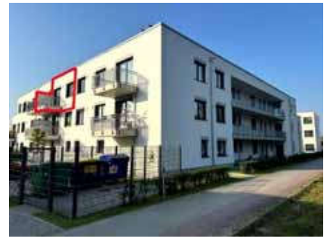
Straßenansicht Karl-Marx-Straße 62 (Haus G) mit Kennzeichnung Son- dereigentum WE Nr. 39

250.000,00 € (zum Wertermittlungsstichtag)