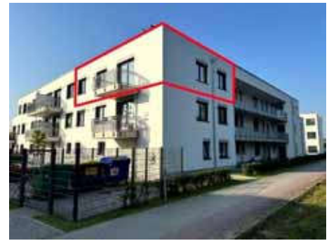
Straßenansicht Karl-Marx-Straße 62 (Haus G) mit Kennzeichnung Son- dereigentum WE Nr. 38

480.000,00 € (zum Wertermittlungsstichtag)