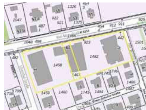
Ausschnitt Katasterkarte, Kennzeich- nung Bewertungsgrundstück gelb