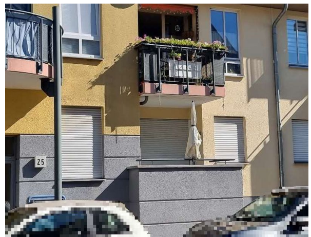
Wohnung im EG rechts mit Loggia / Balkon