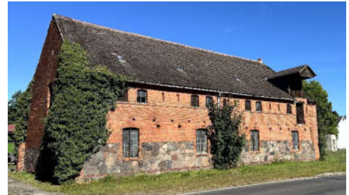
BV Nr. 6, Funktions-/Nebengebäude

BV Nr. 6: Gemarkung Kletzke, Flur 8, Flurstück 9 (726 m 2 ); Dorfstraße in 19339 Plattenburg OT Kletzke; bebaut mit Funktions-/Nebengebäude