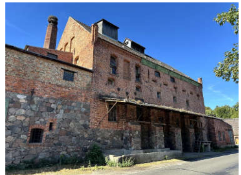
BV Nr. 7, ehemalige Mühle

Auf Grund der Außenbesichtigung sind keine abschließenden Angaben möglich. Die vorhandenen Baulichkeiten sind aus sachverständiger Sicht nicht wirtschaftlich nutzbar und besitzen keinen Substanzwert. Ein Ertrag kann nicht erzielt werden. Auf Grund der fehlenden wirtschaftlichen Nutzbarkeit bzw. den abbruchreifen/funktionslosen baulichen Anlagen ist die Freilegung zu unterstellen.