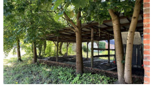
BV Nr. 5, Unterstand

Grundbuch von Kletzke, Blatt 386 BV Nr. 5: Gemarkung Kletzke, Flur 8, Flurstück 8 (859 m 2 ); Dorfstraße in 19339 Plattenburg OT Kletzke; bebaut mit einem Unterstand; überbaut durch Nachbargrundstück