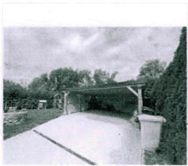
Carport mit Auffahrt