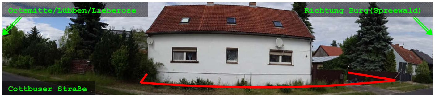
Panoramafoto mit Gesamtsituation in der Cottbuser Straße mit Blick zu dem Grundstück und etwaiger Abgrenzung