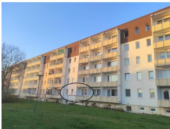
Ansicht Süd (Lage der Wohnung)