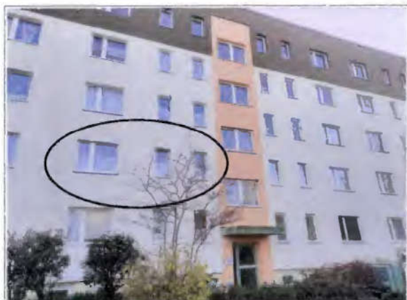
Straßenansicht (Nordseite), Lage der Wohnung