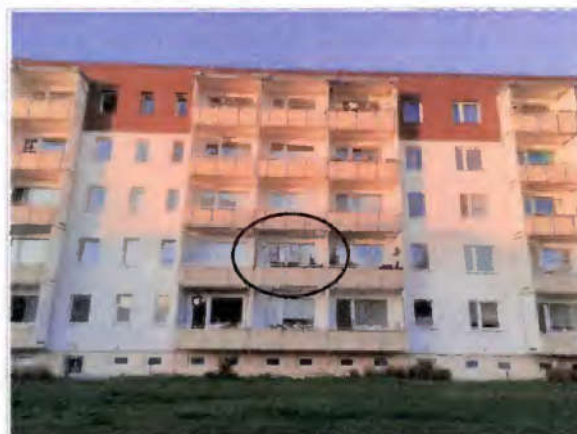
Hofansicht (Südseite), Lage der Wohnung