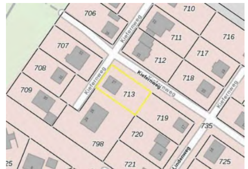
Ausschnitt Katasterkarte, Kennzeichnung Bewertungsgrundstück gelb

Hinweis: Die Verkehrswertermittlung erfolgt auf der Grundlage einer Außenbesichtigung von den straßenseitigen Grundstücksgrenzen aus.