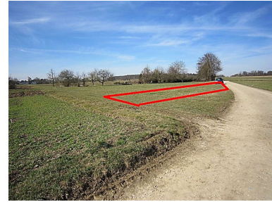
Flst. 1931 Wiese

Grundstücke: Flst. 1894 , Grundstücksgröße: 1.461 m 2 Flst. 1931, Grundstücksgröße 381 m 2