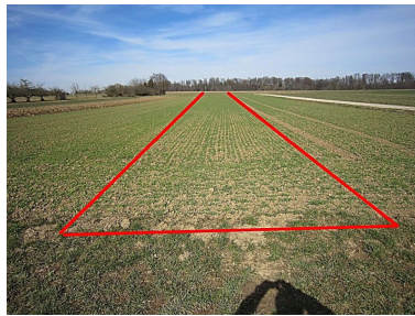
Flst. 1894 Acker