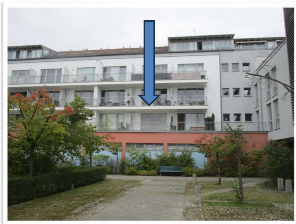
Ansicht von Süden - Eigentumswohnung Nr.15