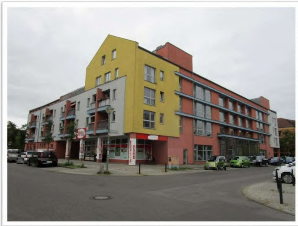
Wohnanlage Anni- von- Gottberg- Straße 11, 13, Clara- Schumann- Str.2