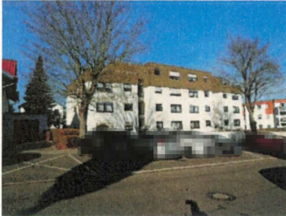
Ansicht von Südosten