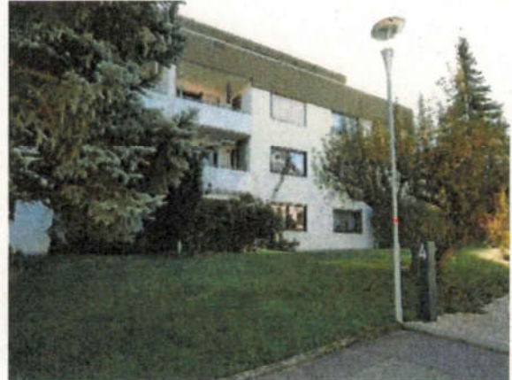
Ansicht von Nordwesten