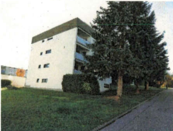
Ansicht von Nordwesten